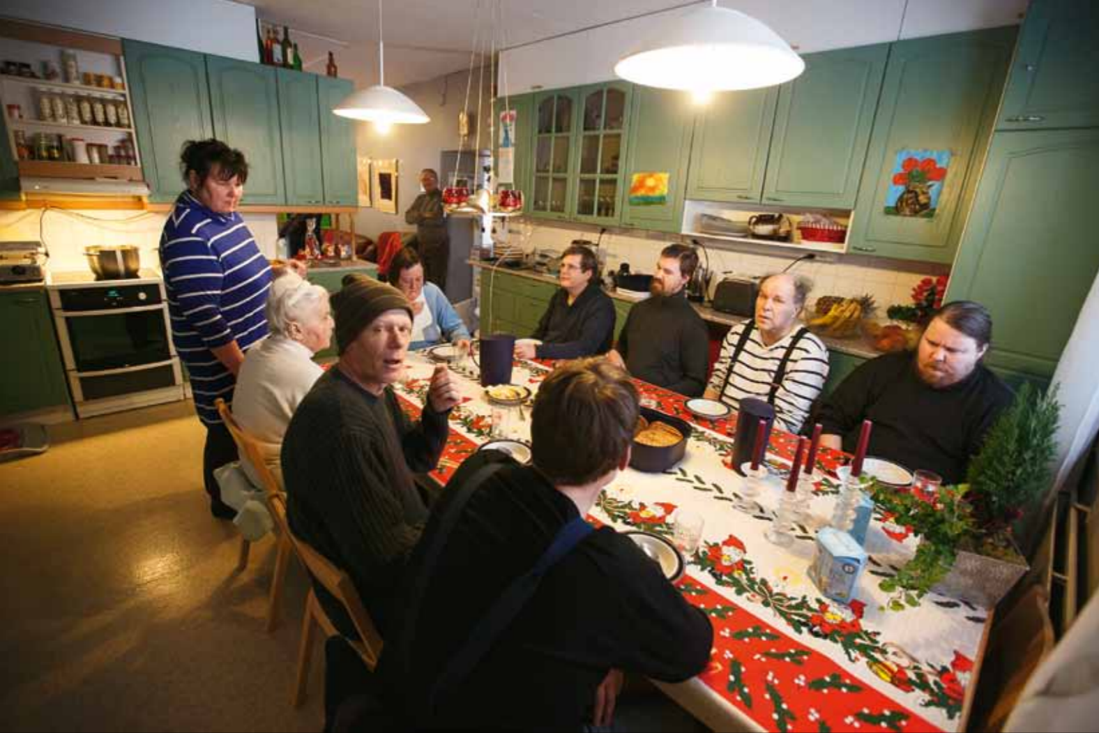
Ruokapöydässä istuu arkisin kymmenkunta henkeä. Puheenporina on välillä kova, kun mietitään, missä järjestyksessä lähdetään hakemaan ruokaa.